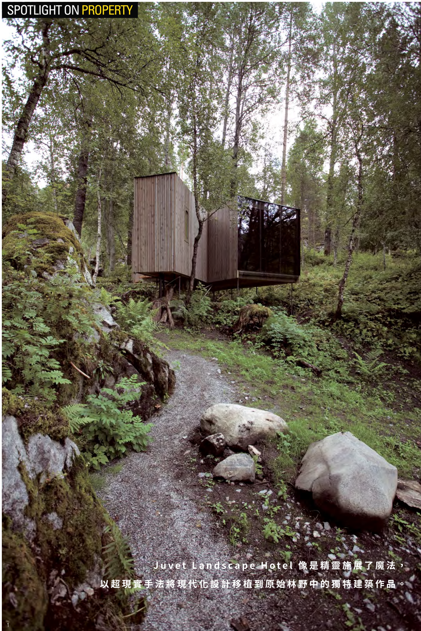
Juvet Landscape Hotel 像是精靈施展了魔法， 以超現實手法將現代化設計移植到原始林野中的獨特建築作品。